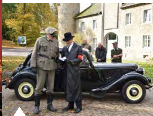
Cérémonies de commémoration à Schaltin : fondation de l'institut de Schaltin et 75 ans de la rafle des enfants juifs et des réfractaires au service du travail obligatoire