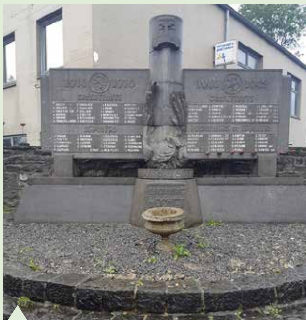
Entretien des monuments de la commune