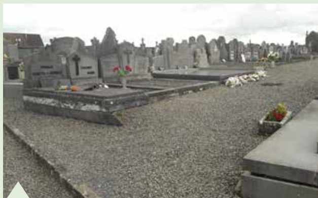
Entretien des différents cimetières de la commune