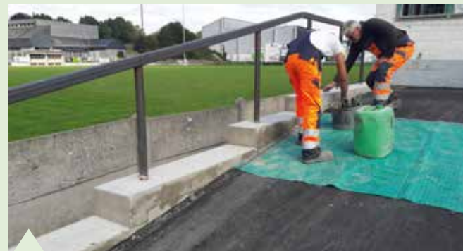
Rénovation de la rampe de la buvette du Condruzien à Hamois