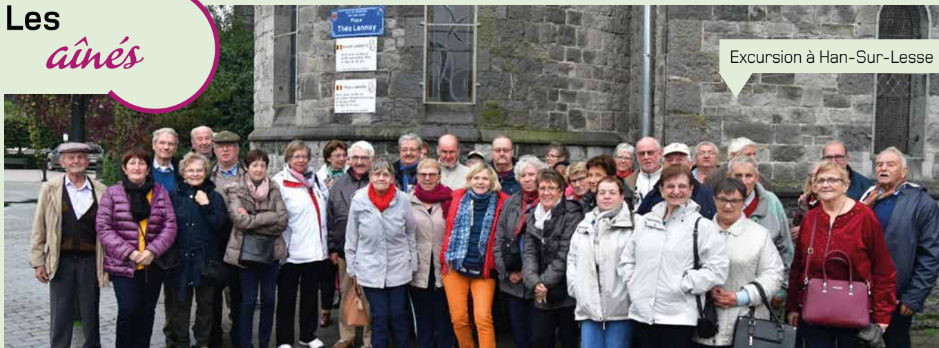
Excursion à Han-Sur-Lesse