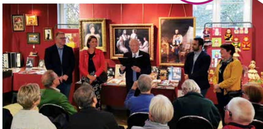
Inauguration du Festival de Russie